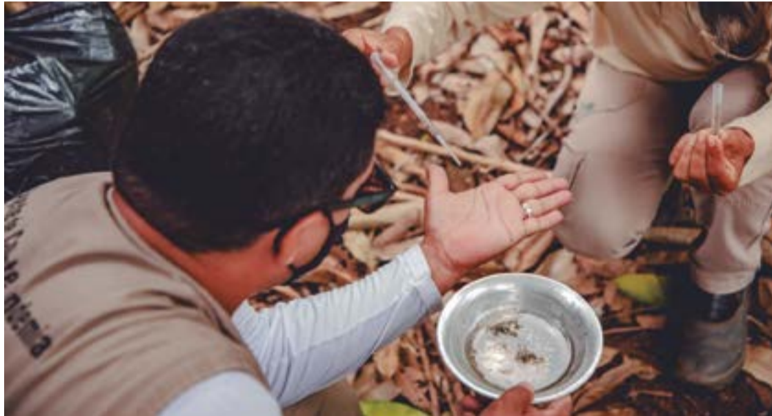
Os bairros com maior número de registros são Vila Jaiara (408), Bairro de Lourdes (364) e Setor Central (261)

ano de 2023, circulou os sorotipos DENV 1 e DENV 2. Os meses de março, abril e maio foram os que tiveram a maior incidência de casos confirmados de dengue, com média de 152 por mês. O bairro com o maior número de moradores nos registros de notificação foi a Jaiara (408), seguido pelo Bairro de Lourdes (364), Setor Central (261), Vivian Parque (225), Parque dos Pirineus (225), Recanto do Sol (204), Boa Vista (198) e Jardim Primavera (171).