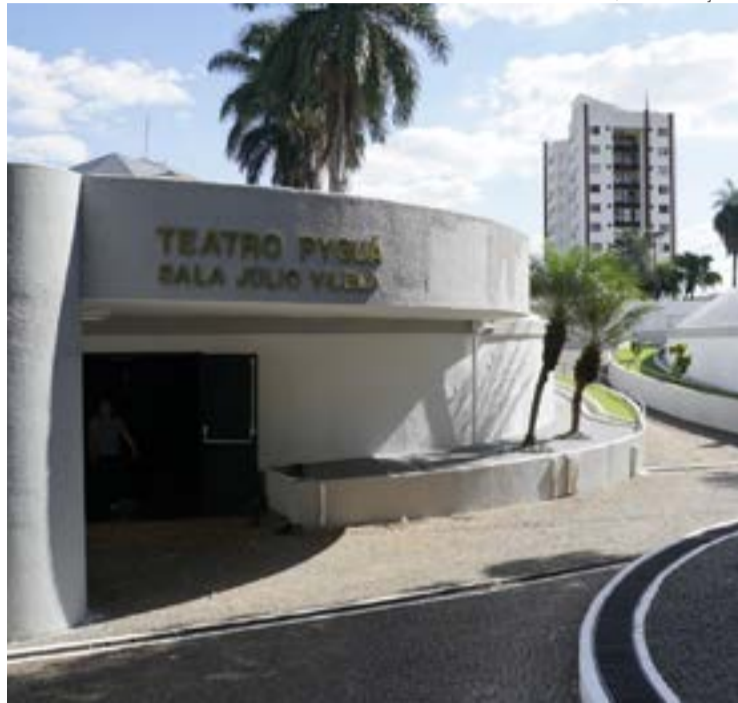
Martim Cererê, Setor Sul: espaço teve reparo em suas instalações