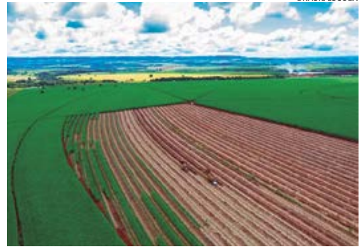
Desempenho reflete investimentos estratégicos em áreas em evolução