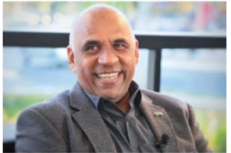
Rogério Cruz: obras serão aceleradas em 2024