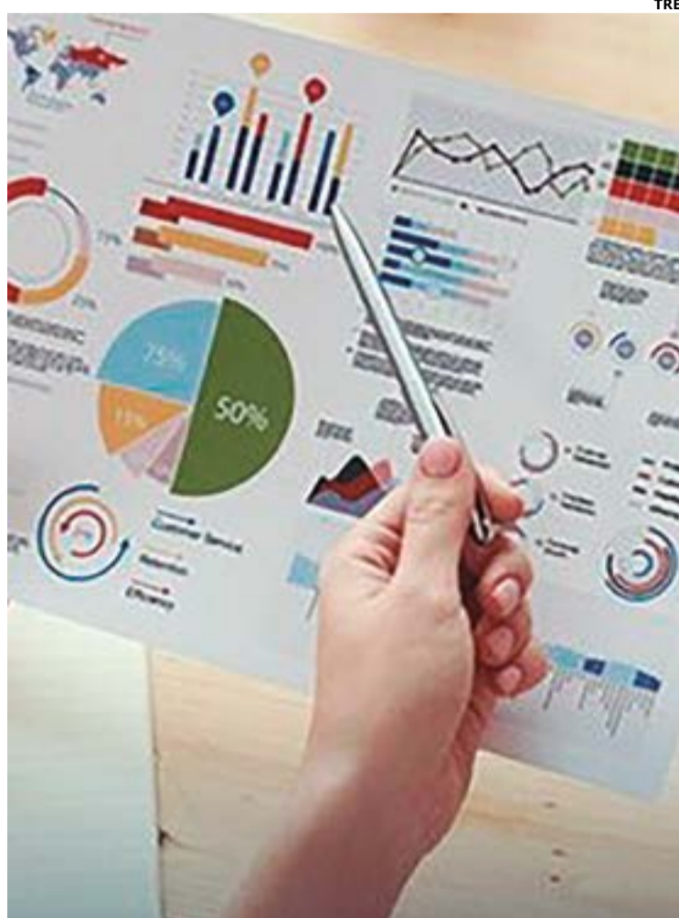
Sondagens devem ser registradas no mínimo 5 dias antes da divulgação

Multa para quem não fizer registro do levantamento no mínimo cinco dias antes da divulgação pode chegar a R$ 106 mil