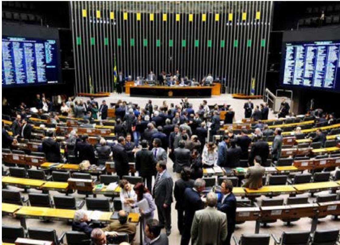
Congresso Nacional "engessa" Orçamento da União par 2024 e "trava" projetos de Lula

Vitrine de obras e importante ferramenta para os petistas nas eleições municipais de 2024, o Programa de Aceleração do Crescimento (PAC) terminou com uma previsão de R$