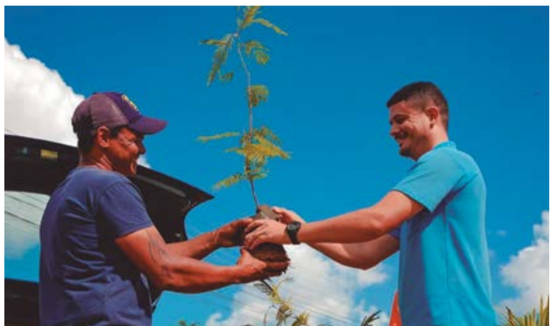
Já foram doadas mais de 13 mil mudas, coletadas 2,5 ton. de recicláveis e arrecadados 500 kg de alimentos

No local de troca, os interessados realizarão o seu cadastro mediante o preenchimento de uma Ficha de Requerimento. O documento deverá obrigatoriamente ser preenchido, uma vez que para a obtenção das mudas, será preciso assinar um Termo de Responsabilidade além de receber um panfleto com as informações necessárias para realizar o plantio de forma correta.