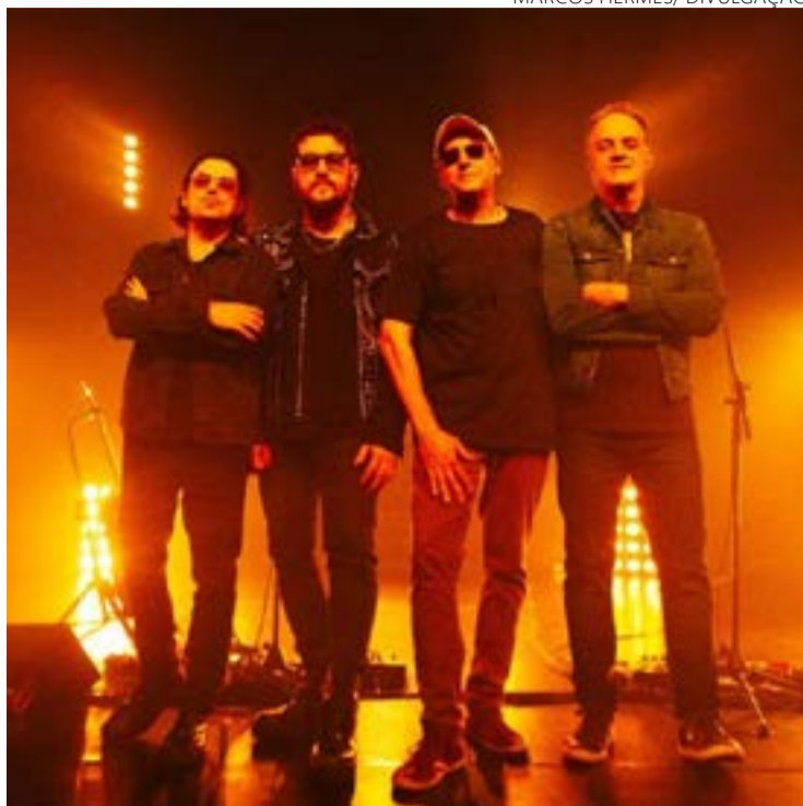
Barão Vermelho: banda tocou em Goiânia no mês de julho

Pessoas de diferentes gerações cantaram letras responsáveis por desferir golpes certeiros à ditadura. Não se intimidaram, como se a mensagem ainda estivesse presa à garganta. A música do octeto (Marcelo Fromer faleceu em 2001) transita pelo punk. Não um punk qualquer, e sim um com letras concretistas e, de repente, chegaram ao “Cabeça”, uma rebeldia mais indigesta aos olhos da classe média do que o canto que vinha à la The Clash de Brasília. Esse sentimento levou os gritos a ecoaram pelos prédios desenhados por Niemeyer.