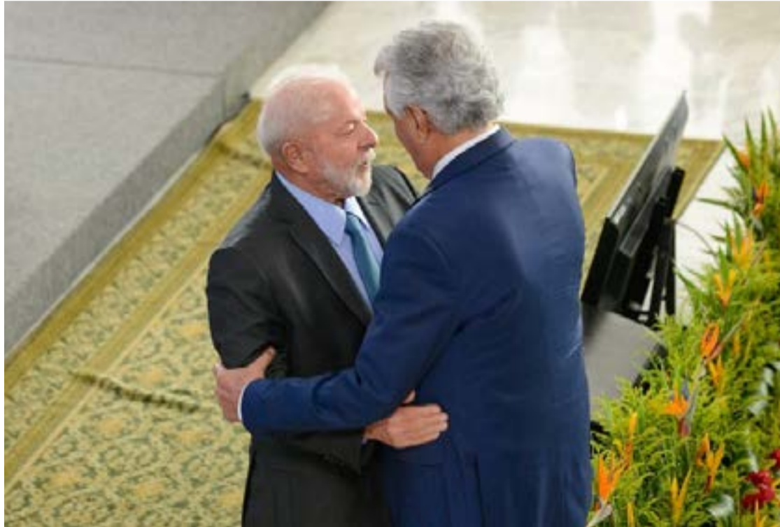
Lula da Silva e Ronaldo Caiado: harmonia na relação, apesar das diferenças partidárias

A declaração do governador goiano foi muito bem recebida pelo Palácio do Planalto, que tem visto no governador goiano um aliado quando o assunto