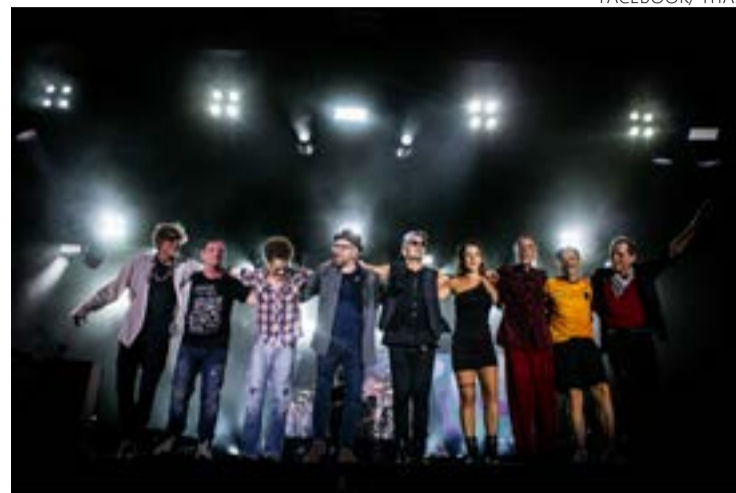
Titãs Encontro: turnê passou pela Capital em junho

Havia um receio coletivo. Desde 2017, os vocais do Barão já não pertencem mais ao cantor e guitarrista Roberto Frejat. Mas o intrigante, e os goianienses confirmaram isso, é que o grupo carioca sobreviveu à saída não só apenas de um frontman, mas de outro - Cazuza foi o primeiro, em 1985. Para o lu-