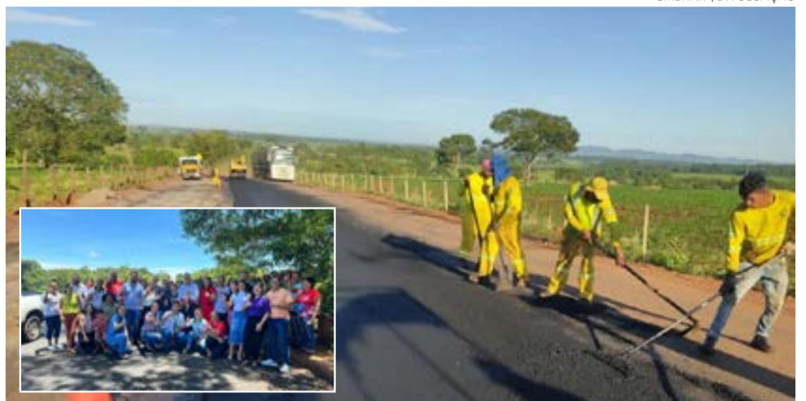
Motoristas terão mais tranquilidade e segurança, diz Ronaldo Caiado, em detalhe, com moradores

Caiado inaugurou também uma passarela metálica de 12 metros de extensão na GO-060, em Santa Bárbara de Goiás, paralela à ponte sobre o cór-