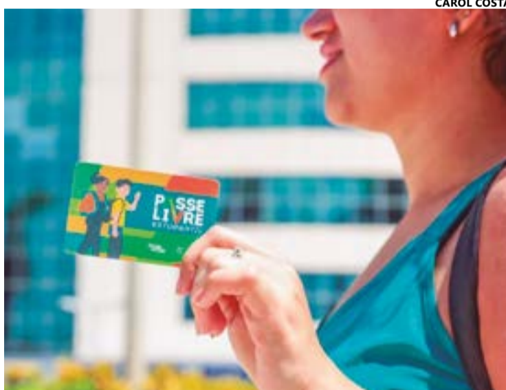
Passe Livre Estudantil paga deslocamento de alunos de cadastro regular

Para garantir o benefício, o estudante novato deve realizar o cadastramento e fornecer os dados e documentos pessoais. Já o veterano deve fazer o recadastramen-