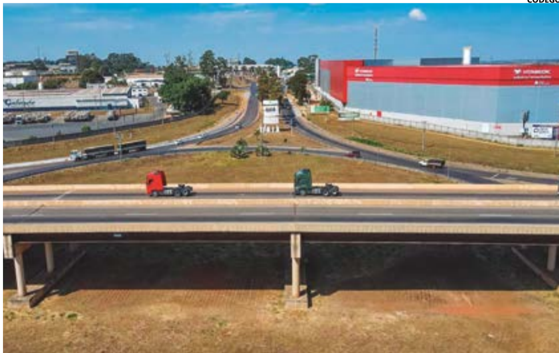
Distrito tem 149 empresas instaladas, várias em ampliação e nova área de 1,7 milhão de m² para expansão

Com o projeto do DaiaPlam, expansão do distrito, em andamento, o percentual de funcio-