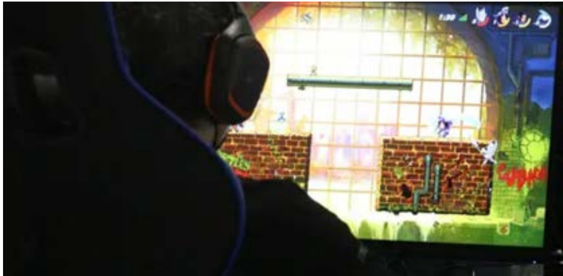
Esqueça as profissões tradicionais: IA e produção de games devem dominar mercados nos próximos meses

profissionais diante da digitalização das empresas vai tomar Goiás - e outros estados - em muito breve.