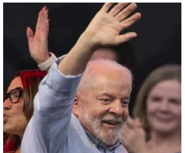
Lula da Silva: visitas serão intensificadas nos estados em 2024

Lula vai aproveitar as viagens ao interior do país para reforçar as campanhas do PT e de partidos aliados na corrida às 5.750 mil prefeituras, com foco, principalmente, nas 26 capitais (Brasília não tem eleição para prefeito.