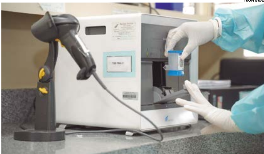
Detecção da doença foi ampliada ao longo do ano de 2023 por meio do Teste Rápido para Tuberculose

A tuberculose é uma doença causada por meio de um bacilo que afeta principalmente os pulmões. Quando não diagnosticada nem tratada precocemente, pode gerar complicações, infecção generalizada (sépsis) e risco de morte. A transmissão ocorre pelas vias aéreas superiores (ao tossir, falar ou espirrar), por pessoas doentes e que não estão em tratamento. Apesar da gravidade, a tuberculose tem cura e é tratada gratuitamente nas unidades de atenção à saúde, com a distribuição dos medicamentos exclusivamente pelo Sistema Único de Saúde (SUS). A vacina BCG, indicada para crianças até 5 anos, também permite a prevenção de formas graves da doença, como a meningite tuberculosa e a tuberculose miliar. (Com informações SES/GO)